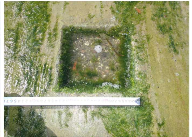
※斜路方塊のホゾ穴 26cm × 26cm × 15cm

※斜路方塊のホゾ穴の閉塞箇所は、既設鉄板ボルトが破損している箇所となります。(10箇所程度)